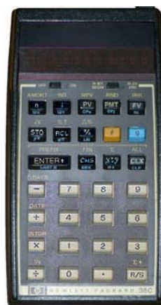
HP38, antecessora da HP12C

quartzo líquido. Baseada na HP38, a HP12C é a representante, para a área financeira, dessa nova geração de calculadoras. A HP12C foi imediatamente acolhida pelos utilizadores que buscavam alta performance e facilidade de uso, aliadas ao moderno visual e à tradicional qualidade HP.